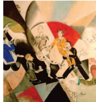
Marc Chagall Einführung in das Jüdische Kammertheater von Moskau (Detail) Museum Frieder Burda Tretjakow-Galerie, Moskau © VG Bild-Kunst, Bonn 2006

Eine übergreifende Werkschau von Marc Chagall präsentiert das Museum Frieder Burda im Sommer 2006. Vom 7. Juli bis 29. Oktober werden unter dem Titel „Chagall. Im neuen Licht“ rund 100 Hauptwerke des 1985 verstorbenen Malers in Baden-Baden gezeigt. Abgedeckt wird die gesamte Schaffensperiode des russischen Malers. Einer der Schwerpunkte ist das selten außerhalb Russlands gezeigte Frühwerk des Künstlers.