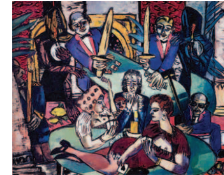
Max Beckmann Traum von Monte Carlo © VG Bild-Kunst, Bonn 2006

Das Zentrum Paul Klee beginnt sein Ausstellungsprogramm 2006 mit «Max Beckmann – Traum des Lebens». Die Ausstellung wird exklusiv für Bern und das ZPK konzipiert und realisiert. Gezeigt wird eine Auswahl von rund 60 Kunstwerken, die aus Beständen namhafter Museen Europas und der USA sowie aus privaten Sammlungen zusammengetragen werden konnten.